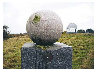
SOLEN PÅ Planetstien i Golfparken i Aalborg. I baggrunden ses Uraniaobservatoriet.

Der er forskel på tro og viden. Men det gør nu ikke noget, at tro undertiden bliver til viden.