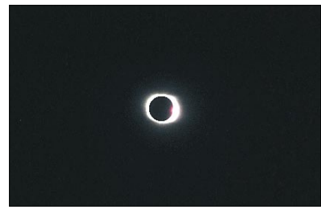
SOLFORMØRKELSEN TRIN for trin